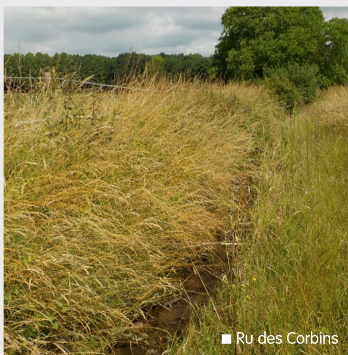
■ Ru des Corbins

La « police de l'eau » réglemente les installations, ouvrages, travaux ou activités (appelés IOTA Installations, Ouvrages, Travaux ou Activités) qui peuvent avoir un impact sur la santé, la sécurité, la ressource en eau et les écosystèmes aquatiques.